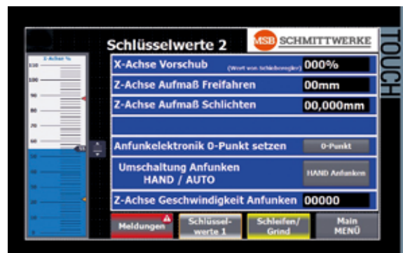
Bilder: BASICgrinder 12" Touch-Bildschirme