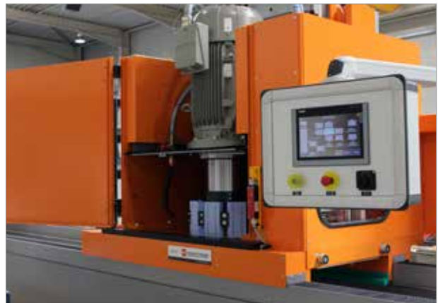
Foto: SOLUTIONgrinder Typ 6000SM