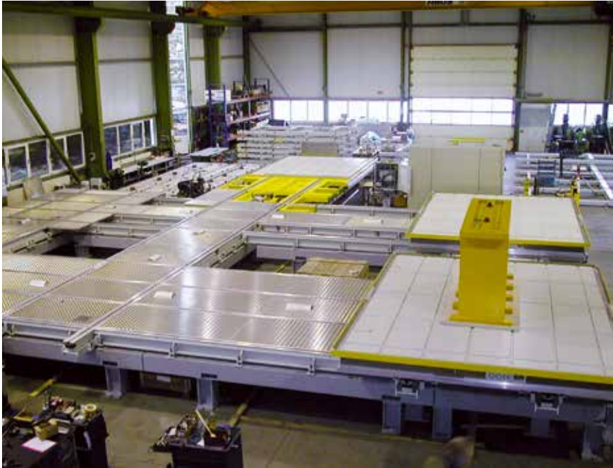
Werkstück- Servier- und Lagersystem (horizontal) Palettengröße 3200 x 4200 mm

Zufriedene Kunden sind das Fundament unseres Erfolges, sie mit höchster Qualität zu bedienen unser Anspruch. Wir beraten unsere Kunden mit qualifiziertem Fachwissen und suchen gemeinsam nach individuellen Lösungen.