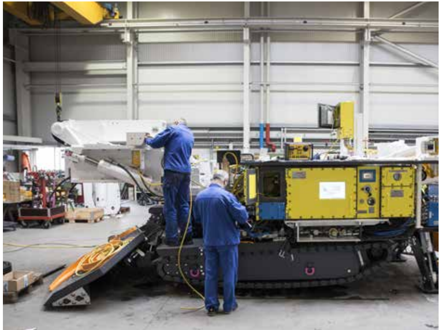
Inbetriebnahme einer Teilschnittmaschine

Leistungsspektrum: Programmierung / Installation Inbetriebnahme / Schaltschrankbau Elektrische Retrofits SOLUTIONgrinder