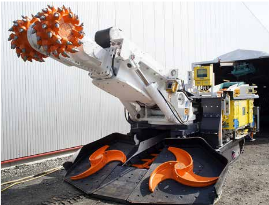
Teilschnittmaschine für den Einsatz im Berg- und Tunnelbau