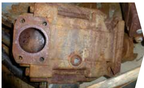
VOR DER ÜBERHOLUNG