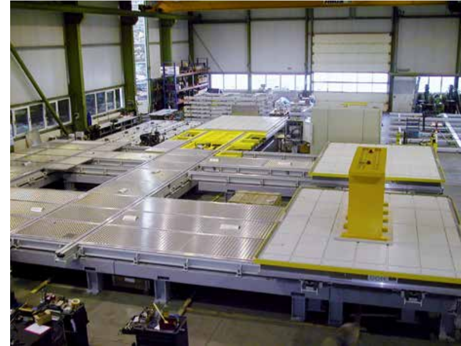
Werkstück- Servier- und Lagersystem (horizontal) Palettengröße 3200 x 4200 mm

Mit eigenen Kompetenzen in Engineering, Teilefertigung und Montage hat sich der Sondermaschinenbau einen hervorragenden Ruf bei einer höchst anspruchsvollen Kundschaft erworben. Mit jahrzehntelangem Know-how entwickeln und produzieren wir kundenspezifische Sondermaschinen und Anlagen, z.B.: