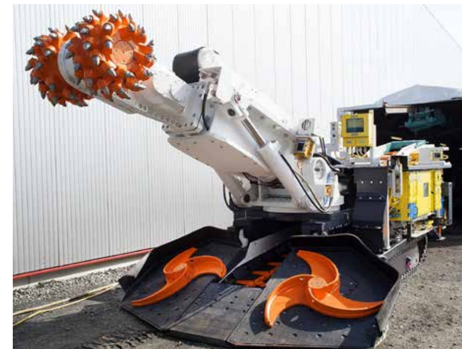
SM150 für Kohlebergbau mit Radarsystem iRoadheader