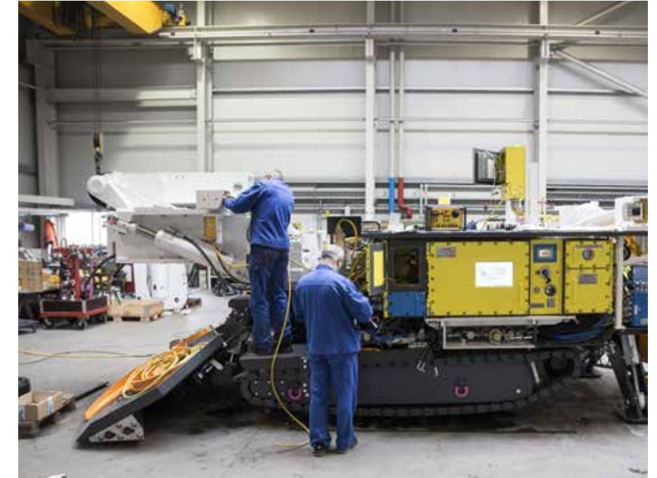
Inbetriebnahme einer Teilschnittmaschine SM150

In jeder Schmittwerke Maschine stecken auch Schmittwerke Steuerungssysteme. Unsere Eigenentwicklungen und Systemintegrationen in den Bereichen SPS-Programmierung, elektrische Antriebstechnik, Bildverarbeitung und Prozessdatenmanagement sind auf aktuellem technischen Stand und haben sich in unterschiedlichsten Einsatzgebieten beim Kunden bestens bewährt.