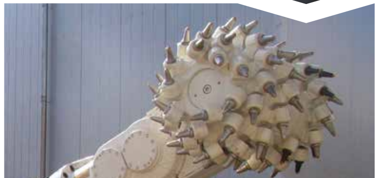
NACH DER ÜBERHOLUNG

Bei einer Generalüberholung oder Modernisierung arbeiten wir Ihnen nach einer ausführlichen Begutachtung des Reparaturumfanges ein detailliertes Angebot aus und besprechen gemeinsam mit Ihnen die Ausführung der Reparaturarbeiten.