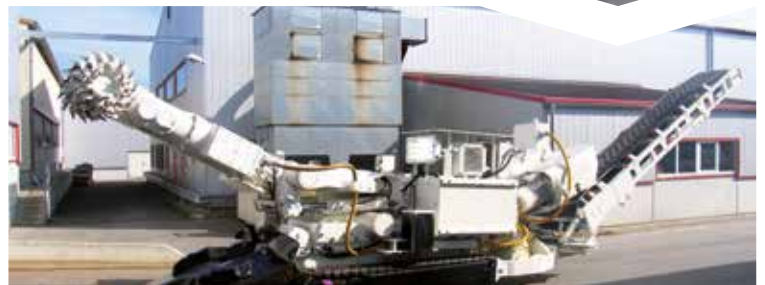
NACH DER ÜBERHOLUNG

IBS ist seit Jahrzehnten im Bereich der Überholung und Modernisierung von eigenen Teilschnittmaschinen, Maschinen fremder Hersteller oder Komponenten, wie Ladegeräte, Ladeeinrichtungen, Schwenkwerke, Fahrwerke etc. auf dem Markt tätig.