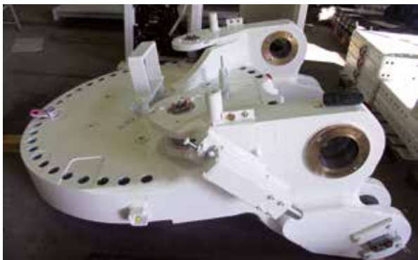
NACH DER ÜBERHOLUNG