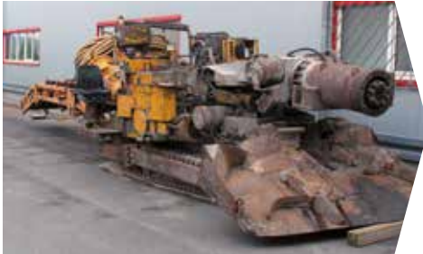
VOR DER ÜBERHOLUNG