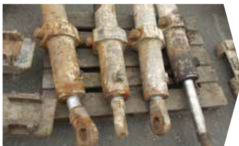
VOR DER ÜBERHOLUNG