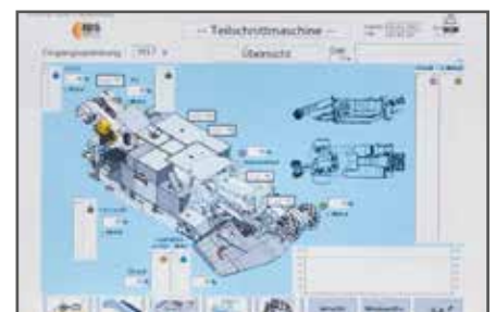
Display zur Visualisierung des Maschinenzustandes