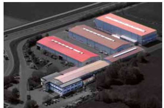
MSB Schmittwerke, Werk 2, Industriegebiet Bischofsheim