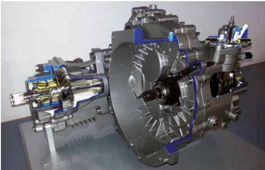
Anfertigung von Messeausstellungsstücken

MSB GmbH & Co. KG Lindenstraße 12 97653 Bischofsheim a.d.Rhön | Germany Tel +49 9772 9111-0 Fax +49 9772 9111-777 www.schmittwerke.com