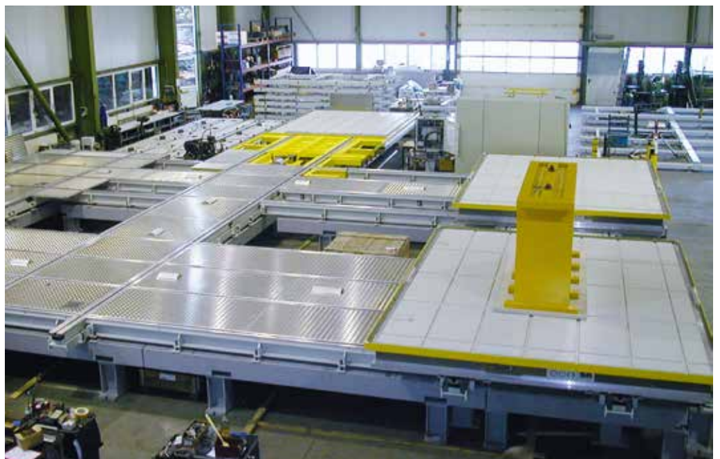
Werkstück- Servier- und Lagersystem (horizontal) Palettengröße 3200 x 4200mm