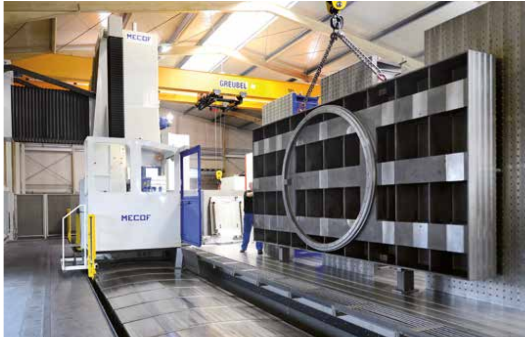
Fräsmaschine mit fahrbarem Ständer

Unsere Kunden kommen aus den verschiedensten Bereichen, z.B. Automobil-, Luftfahrt-, Papierindustrie, Bergbau, Energietechnik.