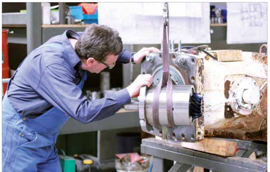
Bestandsaufnahme für die Reparatur eines Getriebes