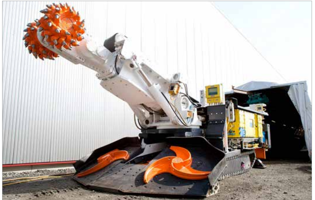
SM150 für Kohlebergbau mit iRoadheader