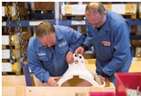
Versand von Ersatzteilen

Schmittwerke MSB GmbH & Co. KG Lindenstraße 12 97653 Bischofsheim/Rhön Germany