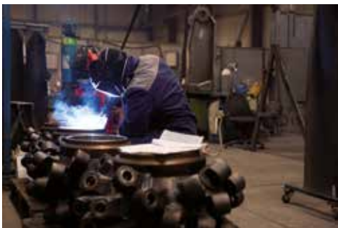
Reparatur von Schrämköpfen